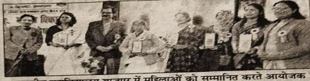
राजकीय महाविद्यालय बाजपुर में महिलाओं को सम्मानित करते आयोजक