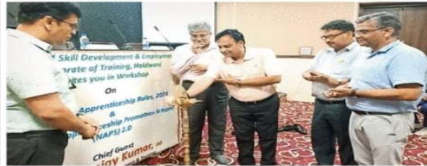
केजीसीसीआई के वेंबर हाउस काशीपुर में नेशनल अप्रेंटिसशिप प्रमोशन स्क्रीम 2.0 में किए गए सुधारों को लेकर मंगलवार को सेमिनार आयोजित किया गया • जागरण