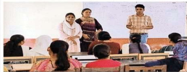
बाजपुर राजकीय स्नातकोत्तर महाविद्यालय में हिंदी पर जानकारी देते प्रोफेसर